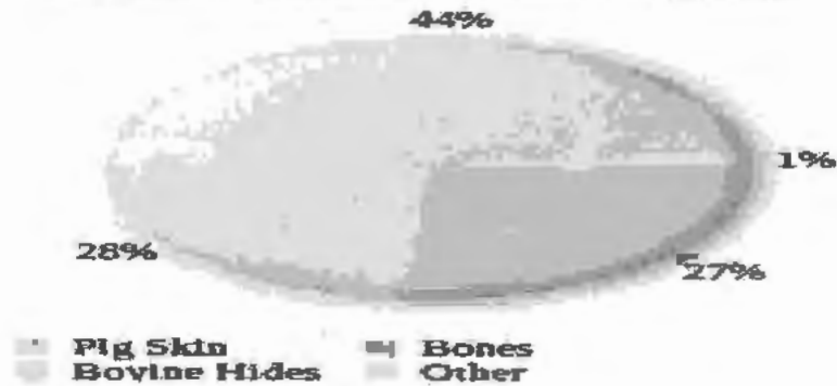
Materials Used in Gelatin Production

ينظر للتفصيل: نزيه حماد، المواد المحرمة و النجسة في الغذاء والدواء بين النظرية و التطبيق، ص 61، و